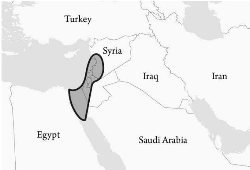
Karte des tatsächlich verheißenen Landes WANN